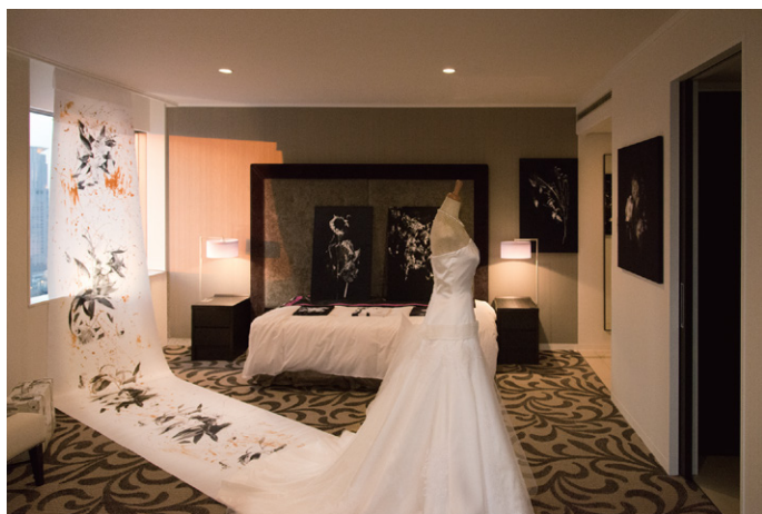
Solo Exhibition "Complex Wedding" at Art Osaka in 2014