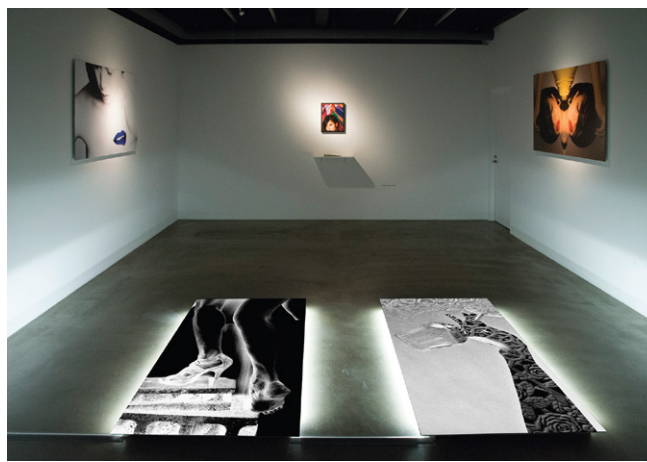
Solo Exhibition 「皮下の過激から理性への回帰」 at TEZUKAYAMA GALLERY, Osaka (2016)