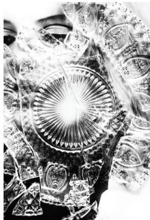
Lost Idea #8 2018 ink-jet print 74 x 54 cm (framed)