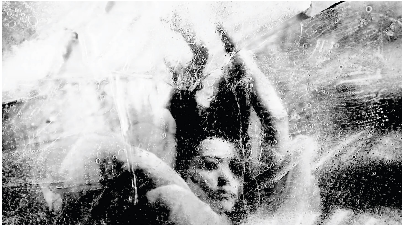
Memorise #1 / 2018 フルHDビデオ 14分25秒・サイズ可変

この度、テヅカヤマギャラリー では、栗棟美里の個展「Still Remained」を開催いたします。