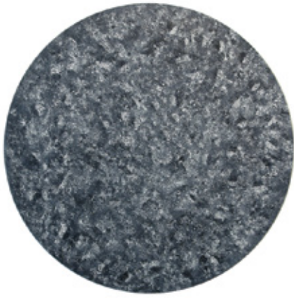
ビッグ盤 / Big Bang 2010 acrylic on wooden panel Φ120 x 2.5 cm