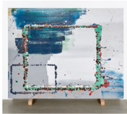
Table Manners 2017 paint, plywood 90 x 115 x 3.7 cm