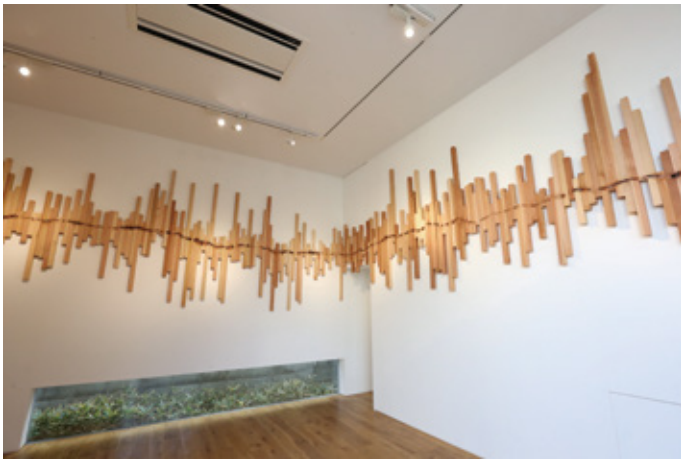
Solo Exhibition "垂木フィクション" at GALLERY ASHIYA SCHULE, Hyogo (2015)