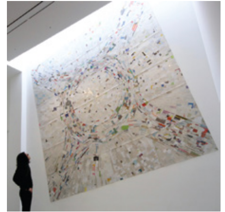
roundabout 2017 collage on paper 459 x 448 cm