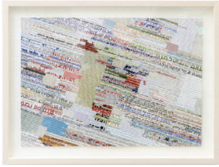
流星のアラブ 01 / Meteoric Arab 01 2017 collage on paper 42 x 59.5 cm