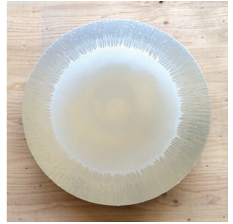
Disk Garage #12 2017 MDF, paint Φ55.4 x 1.2 cm