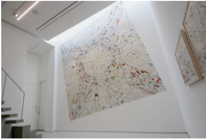
Solo Exhibition "roundabout" at LOKO GALLERY, Tokyo (2017)