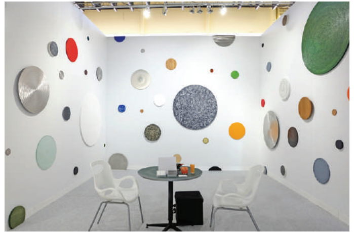
Solo Exhibition "VOLTA NY" at Pier 90, New York (2017)