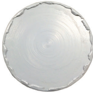
Disk Garage #10 2017 cork board, paint Φ39.5 x 1.5 cm