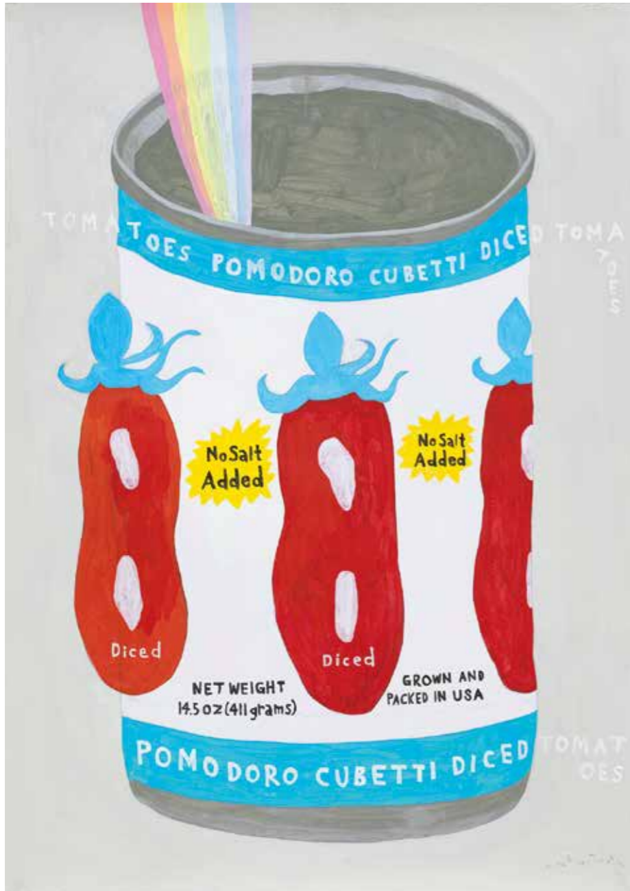
container25 2023 | 1060 x 755 mm acrylic on paper