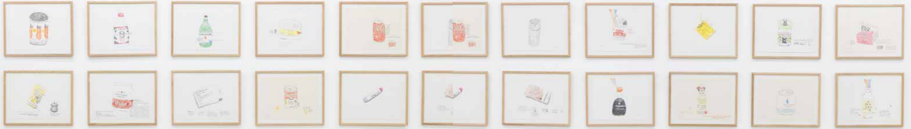
untitled 2023-2024 | 295 x 370 mm *frame size pencil and color pencil on paper