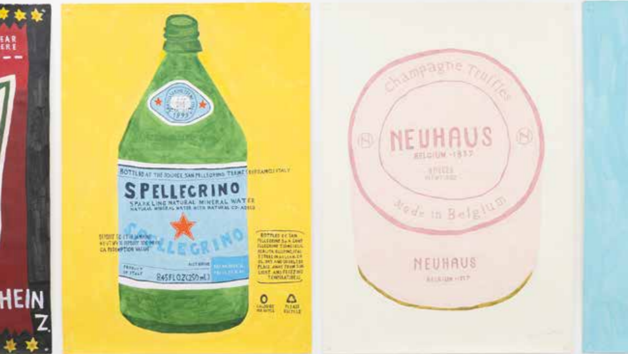
Top Left: container12