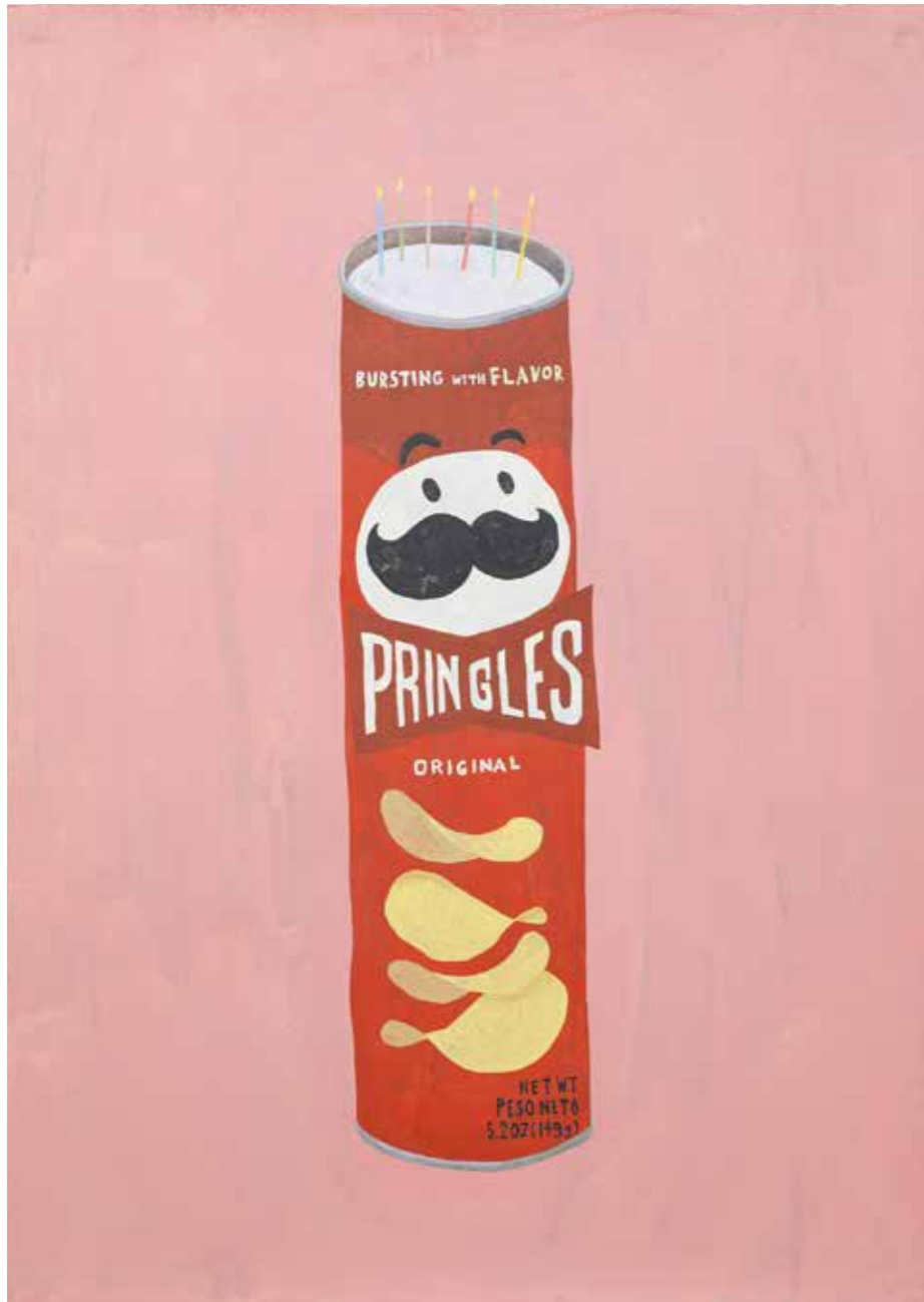
container23 2023 | 1060 x 755 mm acrylic on paper