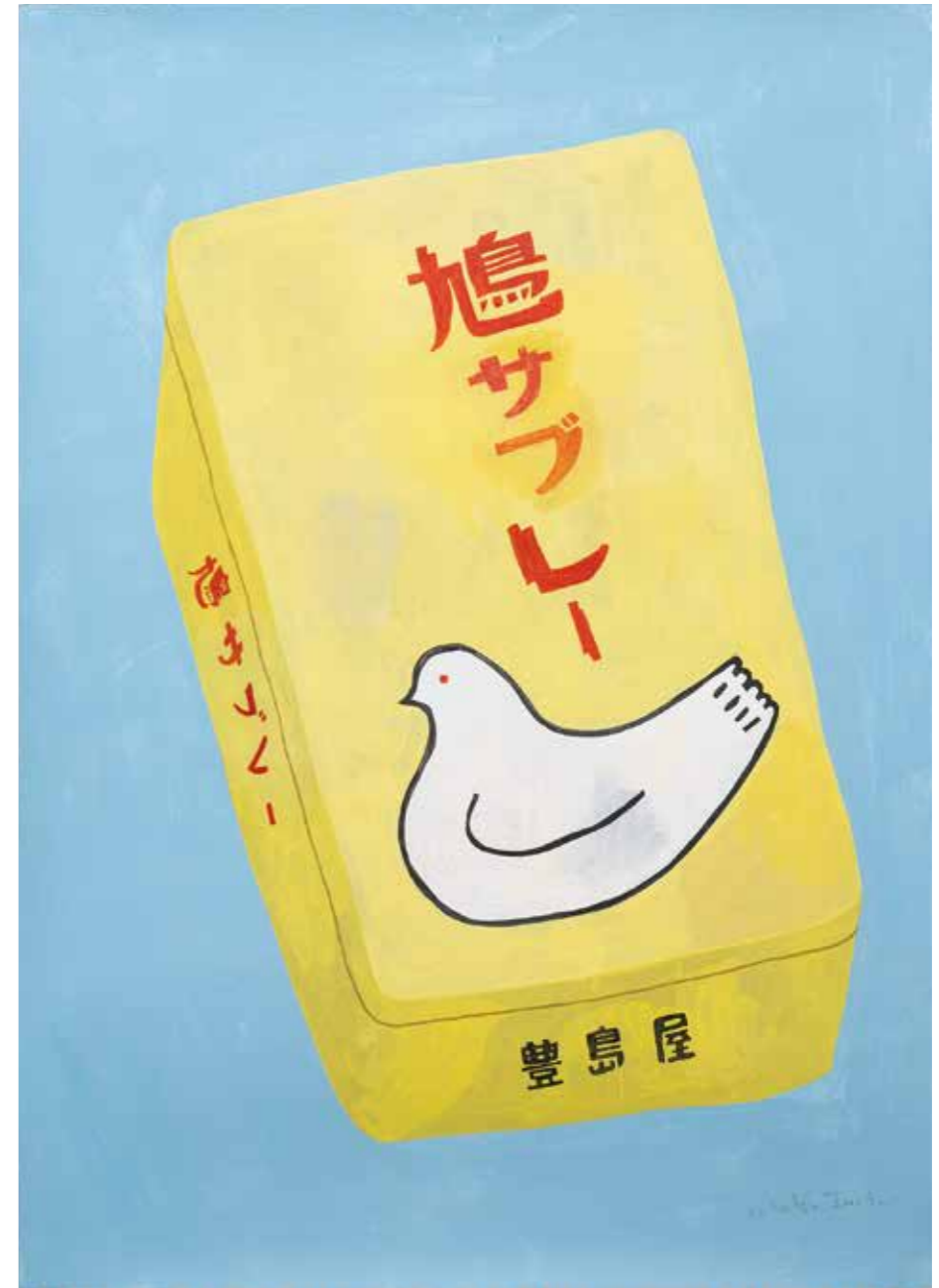
container31 2023 | 1060 × 755 mm acrylic on paper