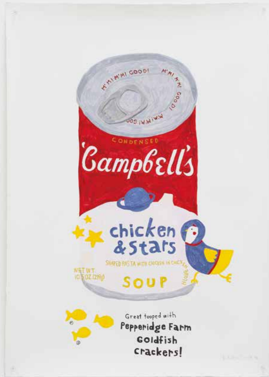
container40 2024 | 785 x 555 mm acrylic on paper