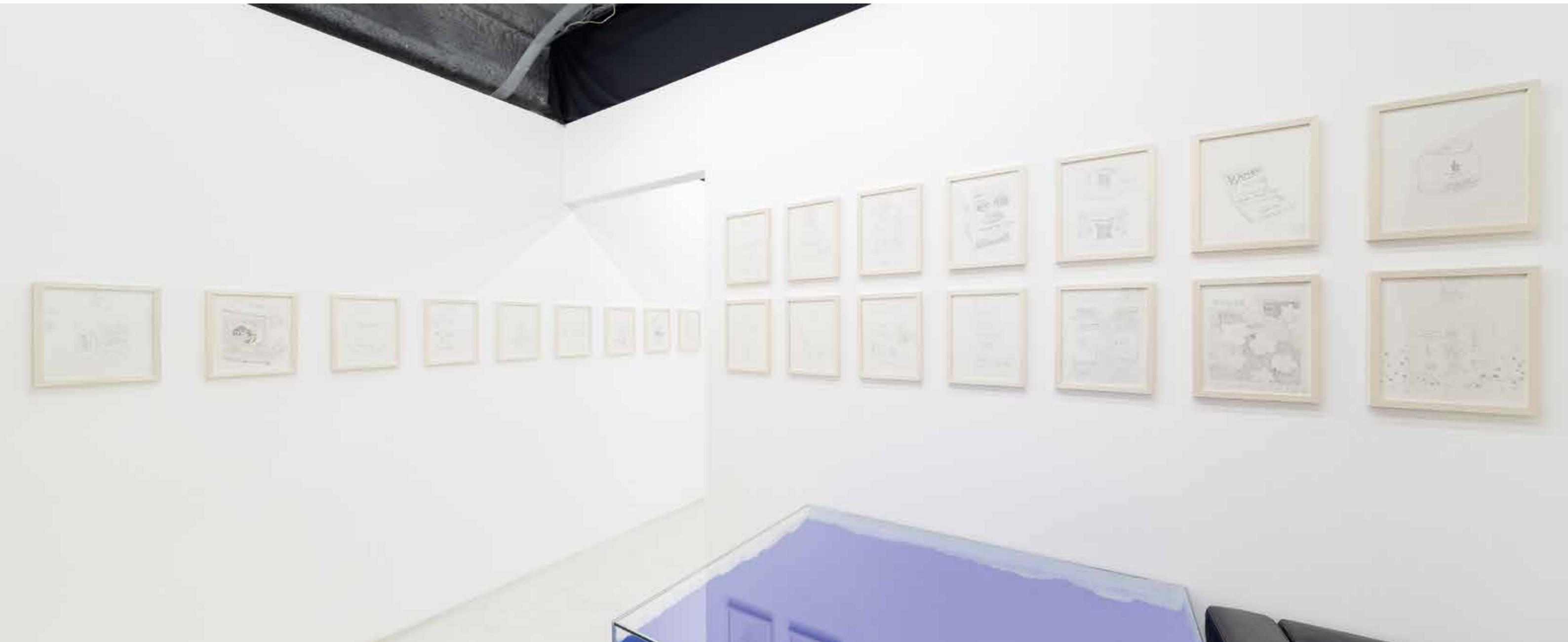
untitled 2023-2024 | 330 x 255 mm *frame size pencil on paper