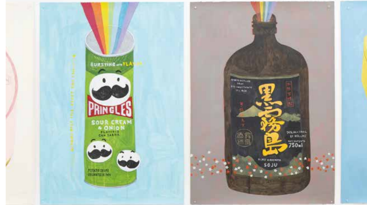
Top Left: container27