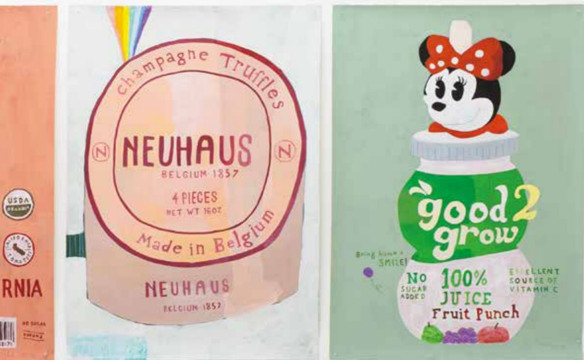
Top Left: container31