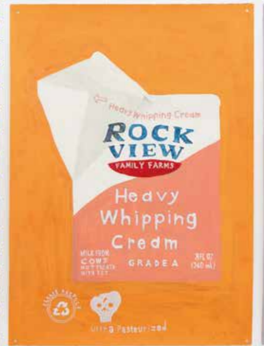
Top Left: container26