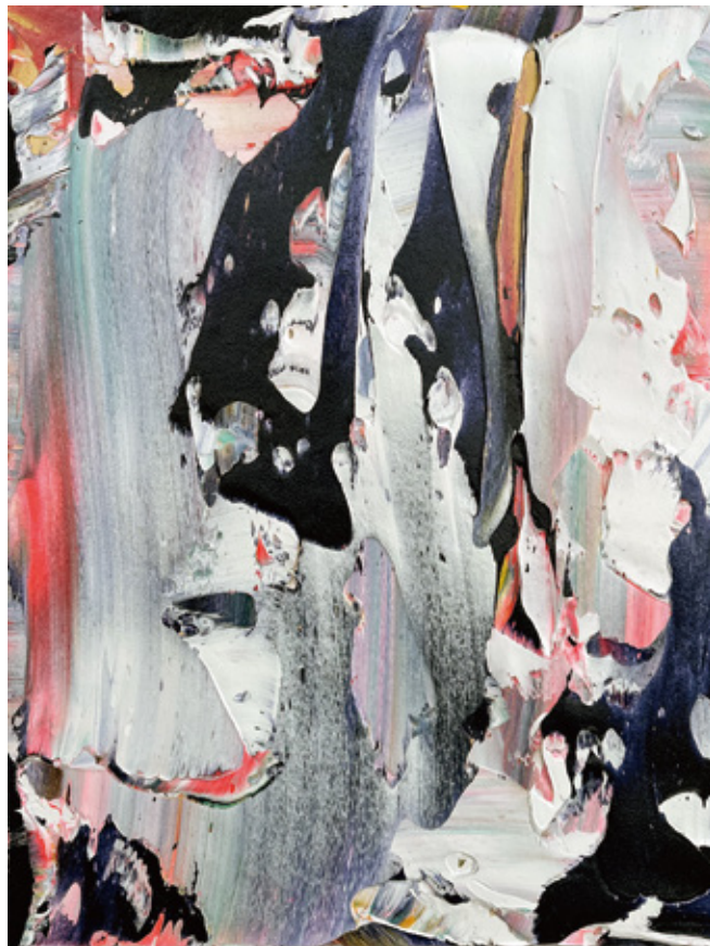
synecdoche H610 × W455 mm Acrylic and Carborundum on cotton 2024